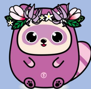
瑞穂町公式キャラクター みずほまる